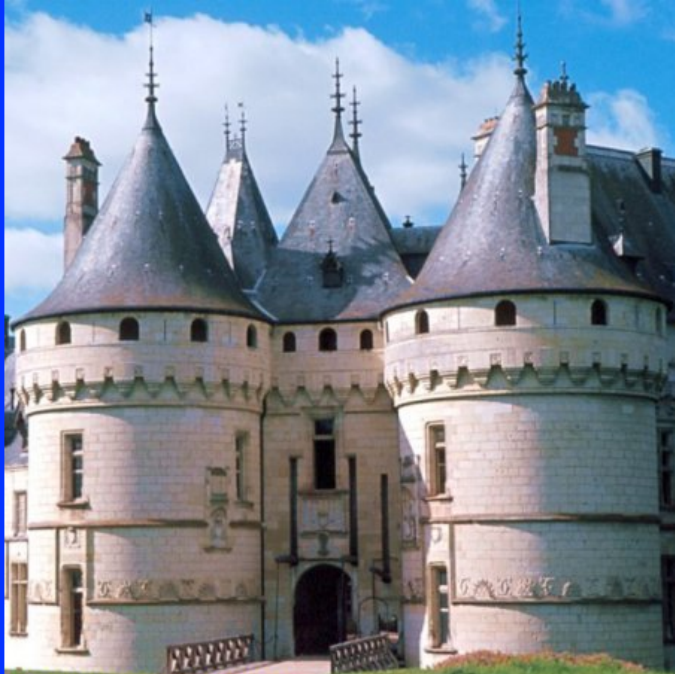
Πύργος σε ρομανικό ρυθμό